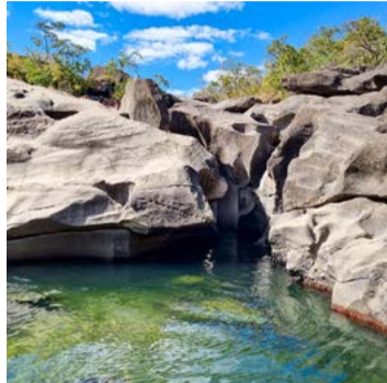
Com rochas esculpidas pela água, Vale da Lua ostenta paisagem única