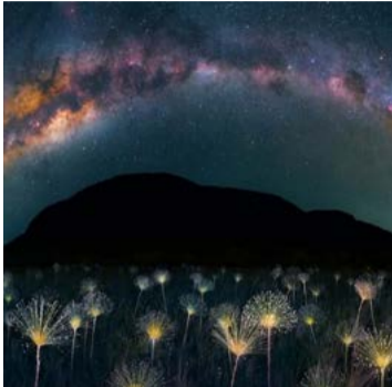
Planta "Chuveirinho": fotógrafo Márcio Cabral ganhou prêmio internacional

Cachoeiras de águas cristalinas, paisagens únicas e uma áurea de misticismo. Estes são alguns dos atrativos que colocaram a Chapada dos Veadeiros no Top 10 de pesquisa que indica locais que brasileiros gostariam de visitar e é procurada por celebridades