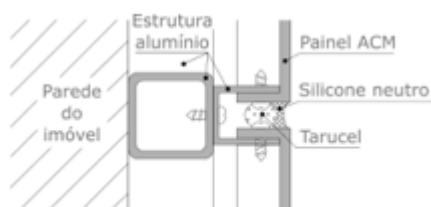
Detalhe de princípio da aplicação dos painéis ACM

3.14.11. Após a conclusão desses reparos, deverá ser instalado, superposto às áreas cegas das fachadas (ver figura abaixo), um revestimento em placas de ACM (sigla em inglês para Material de Alumínio Composto), material leve e ao mesmo tempo rígido, que possui alta resistência. Constituído por um núcleo de polietileno alocado sob pressão entre duas lâminas de alumínio, além do aspecto estético que proporciona uma aparência moderna à edificação, colabora significativamente com o isolamento térmico e acústico do edifício. Vide esquema de fixação abaixo.