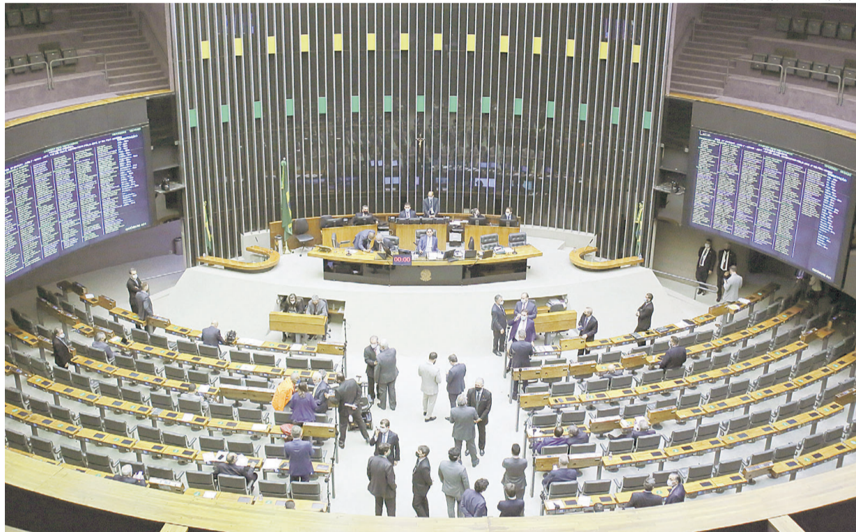
PLENÁRIO da Câmara terá de aprovar alteração do Orçamento da União, cuja proposta será enviada pelo governo