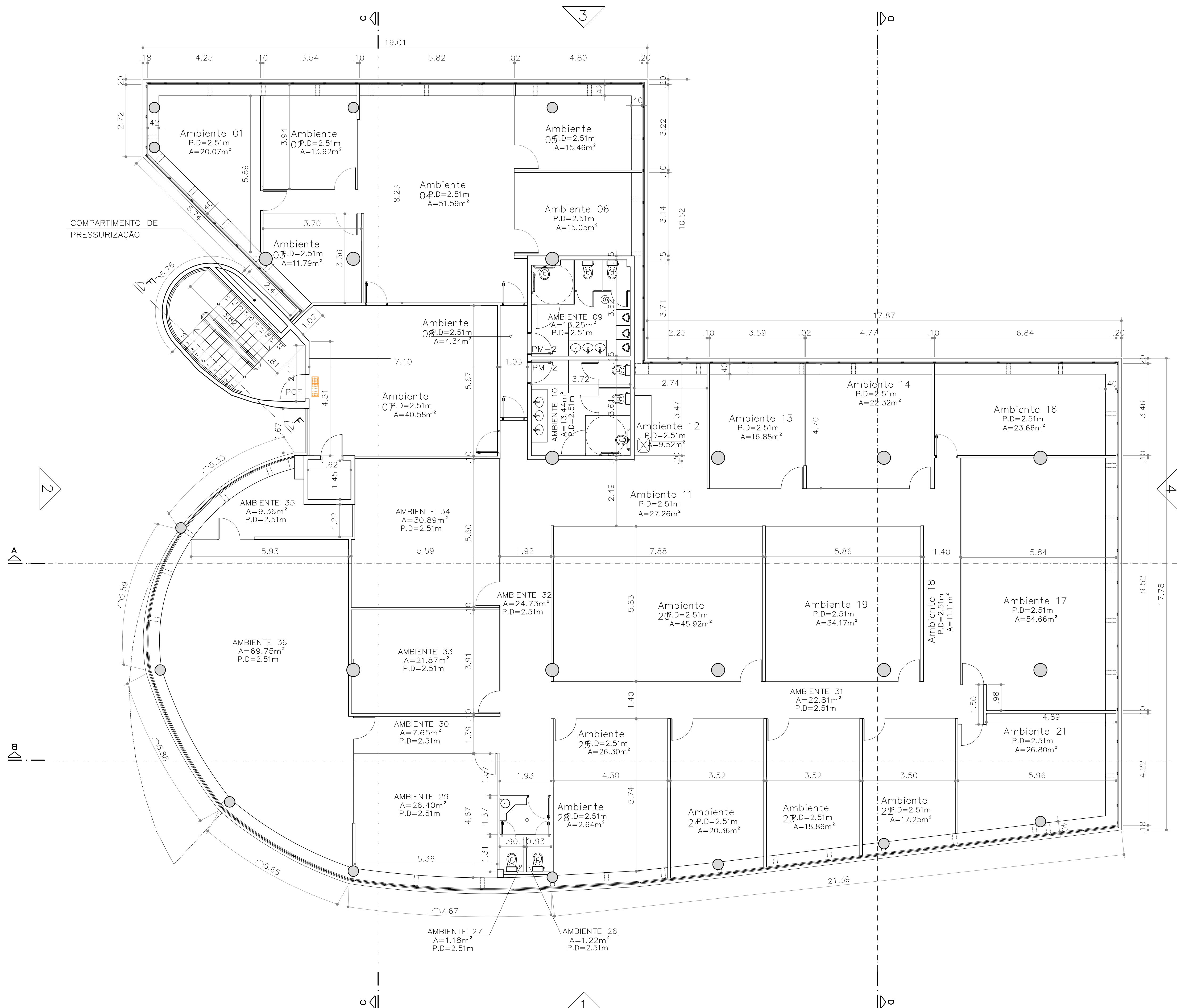
PLANTA BAIXA - 2º PAVIMENTO ESCALA 1/75