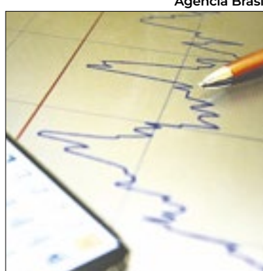
Dados são do Ibre/FGV

O Brasil registrou recuo de 11 pontos no Indicador de Clima Econômico e atingiu 73,5 pontos no primeiro trimestre de 2023. Na sua composição, o Indicador da Situação Atual teve queda de 21,7 pontos alcançando