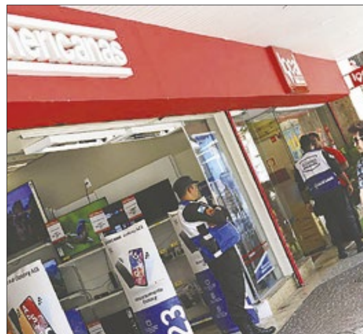
Grupo continuará negociações, para obter consenso

No dia 12 de fevereiro, os acionistas da Americanas haviam proposto um aporte de capital em dinheiro de R$ 7 bilhões. A negociação era liderada por Jorge Paulo