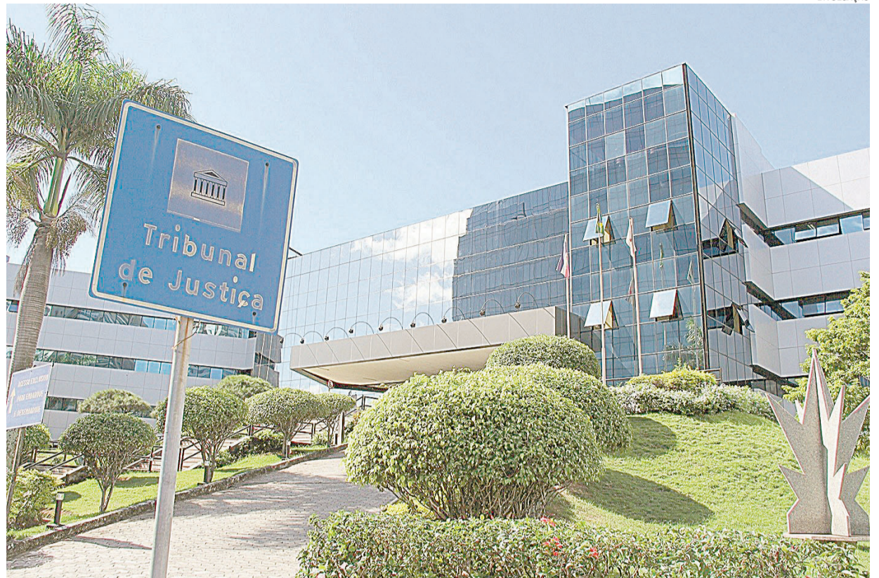
TRIBUNAL DE JUSTIÇA DO ESPÍRITO SANTO, onde os candidatos aprovados vão atuar e ter progressão salarial

nicação Social, Contabilidade, Direito, Economia, Enfermagem, engenharias Civil, Elétrica e Mecânica, Estatística, Letras, Medicina do Trabalho, Pedagogia, Psicologia, Serviço Social e Taquigrafia.